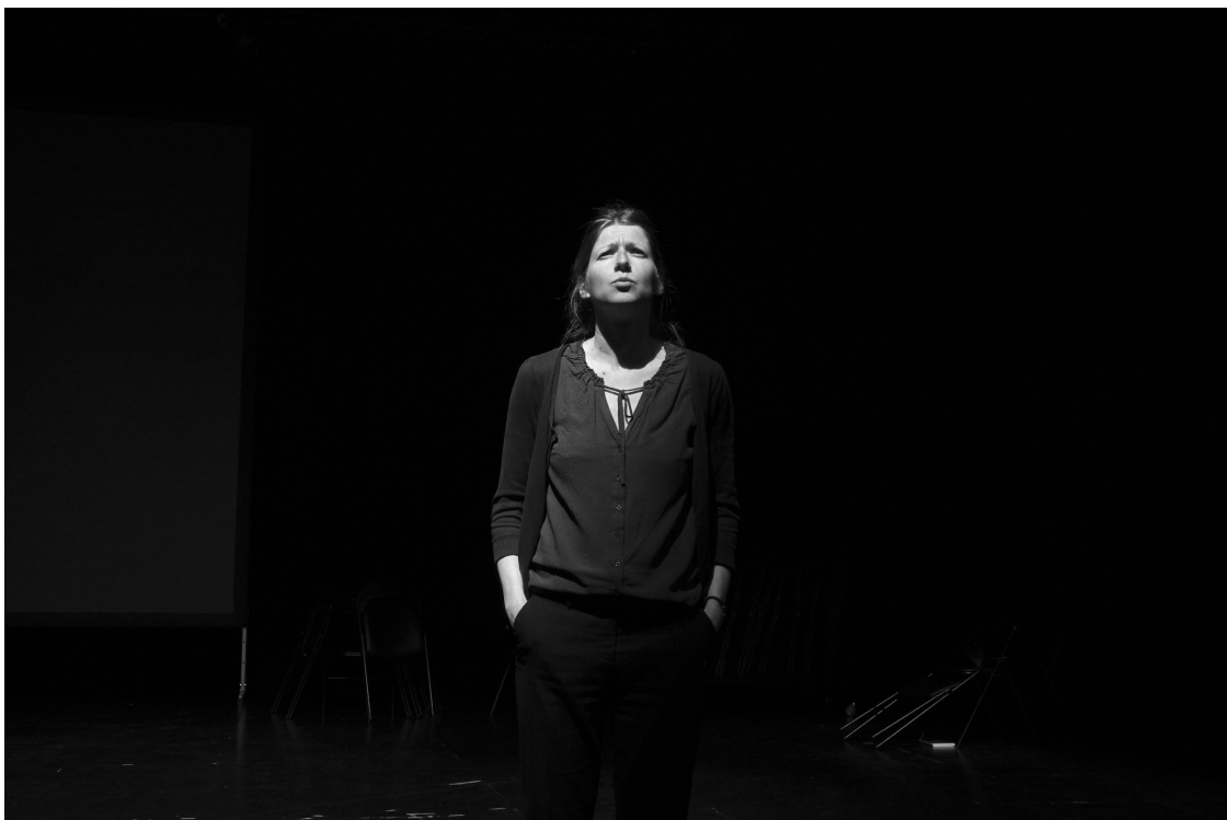
Résidence à Guy Ropartz, Rennes, mars 2018

Cécile propose ainsi une galerie remarquable de personnages fictifs, inventés, inspirés par les témoignages recueils.